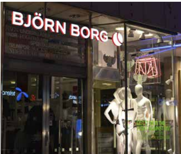
En LPFLEX-skylt – front och sida lyser.