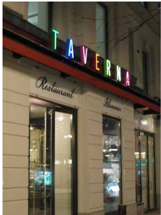
Traditionellt uttryck med modern teknik, framtagen i ett samarbete mellan Focus Neons ateljé, konstruktörer och restaurangens designbyrå.