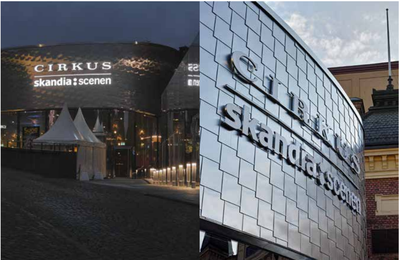
Vissa byggnader eller platser har extra utmaningar i hänsyn till miljön. Den här skylten har extra tunna infästningar och kröker utmed fasaden.