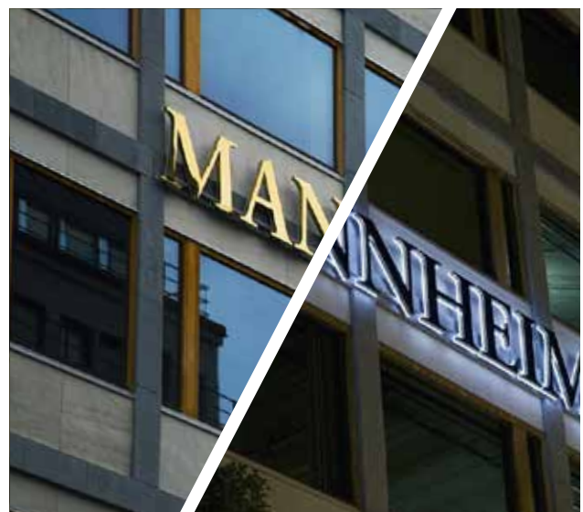
Skylten kan ha olika uttryck om den är släckt eller tänd.

För att beskriva hur skylten kommer se ut på dagen respektive natten när den lyser skapas ritningar, bildmontage och renderade bilder som simulerar skyltens ljus och tredimensionella djup. Ofta skapas flera förslag med olika lösningar som besluts- och offertunderlag.