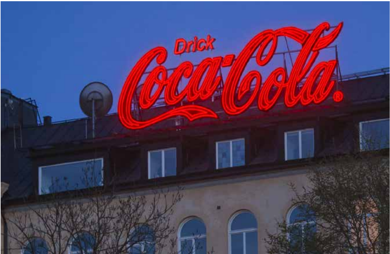
Den klassiska skylten vid Slussen i Stockholm har uppgraderats till modern LED-teknik med bibehållet uttryck.