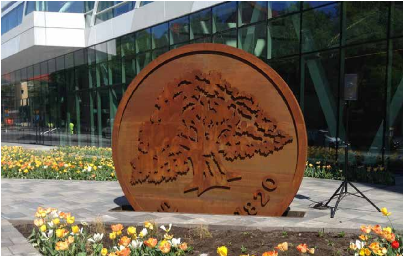
Swedbanks huvudkontor i Sundbyberg. Ett landmärke för besökare. Stensättningen utanför entrén förvandlas till en "sparbössa".